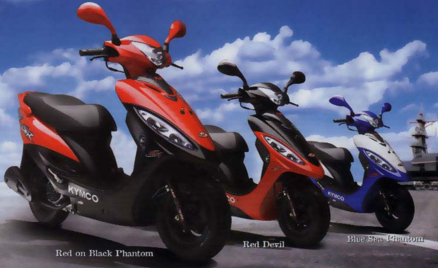
Red on Black Phantom