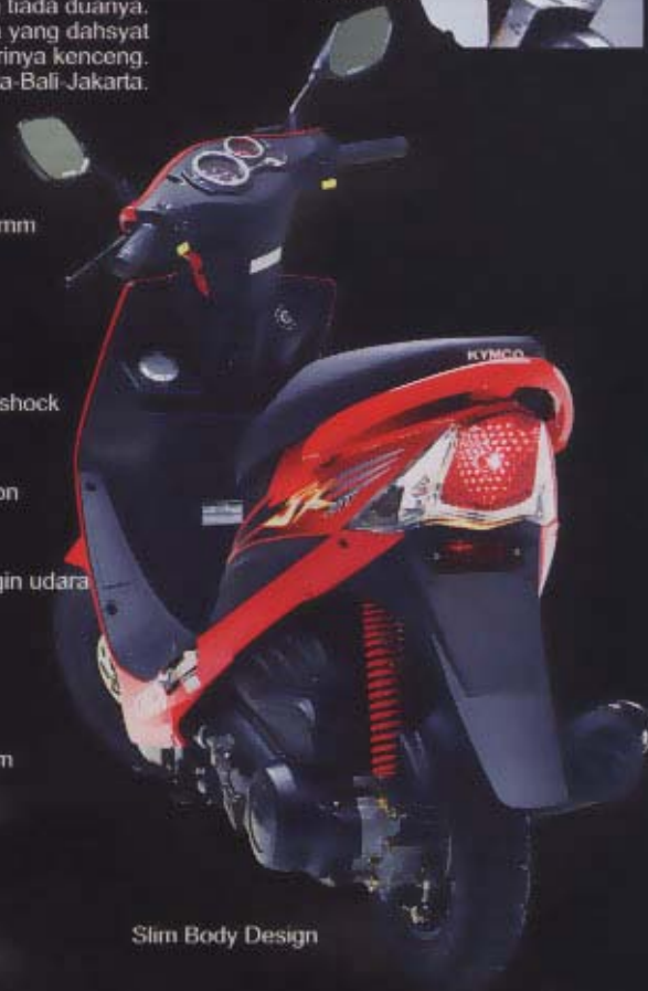
Slim Body Design